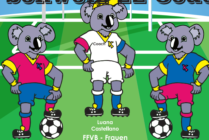
Luana Castellano FFVB - Frauen

Soccer Week mit/with NW Schweiz 22 Coach